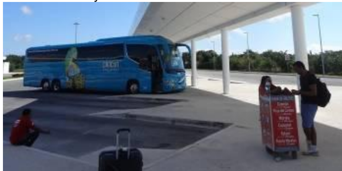
Odjezdové stanoviště ADO u terminálu T4

Použitelný je při příletu na T2, případně i na T3, od T4 je vzdálen asi 20 minut chůze a je lepší jet turistickým autobusem ADO.