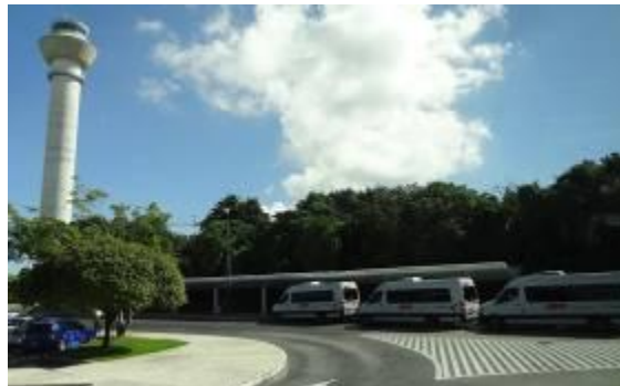
Odjezdové stanoviště mikrobusů u terminálu T2

Za vhodnou kombinaci považuji bydlení v hotelu ve městě Cancún a dojíždění na pláž do zona hotelera. Ubytování i stravování ve městě je výrazně levnější a rozhodně jsem neměl pocit, že by ve městě bylo nebezpečno.