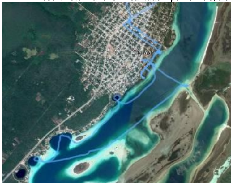
Trasa lodního výletu